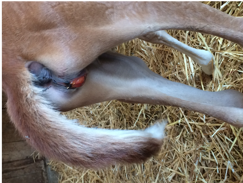
Figura 1. cagna (Sissi). Addome. Epistassi ricorrente.